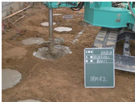
湿式柱状改良工事